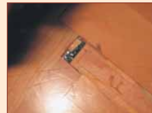
Gutachten ÖBZ: PAK-haltige Parkettkleber

6 Untergrundmaterialien