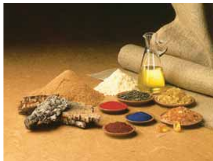
1 Rohstoffe für Linoleumbeläge

Seit ca. 1860 werden Linoleumbeläge in Deutschland hergestellt. Linoleum ist weitgehend lichtecht , bakteriostatisch (Oberfläche des Belags wirkt bakterienhemmend), chemikalienbeständig , eindruckfest , glutecht (kurzzeitig) und ist im Brandfall normal bis schwer entflammbar .